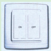
Schalter am Objekt/ im Haus