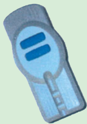
Fernbedienung bis 5 m Reichweite

Schön: Keine störenden Tonnen, Räder, Kleinfahrzeuge usw. vorm Haus.